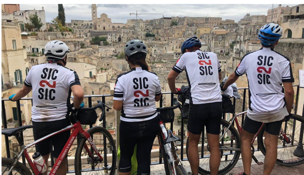
Il Gruppo ai Sassi di Matera

Oltre gli 8 giorni di tour è necessario prevedere una tappa intermedia in un centro abitato.