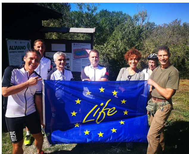
Life nel Parco di Alviano con guida

Il Parco potrà essere attraversato sia in bici che a piedi.