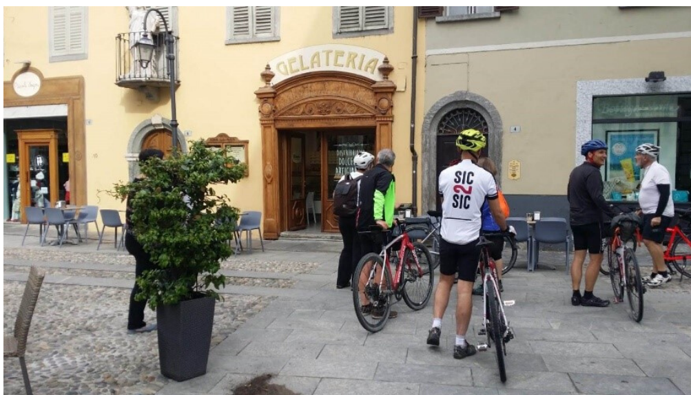
Il Gruppo a Pinerolo TO Piemonte

Il centro abitato è una comodità. E' più facile accedere a servizi, è possibile visitare e godere di attrattori culturali, c'è più scelta di vitto e alloggio (non sempre), occorre però tenere presente la scomodità del raggiungimento (il tempo di attraversamento del centro sia in ingresso che in uscita).