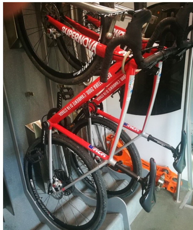
Bici Gravel in Treno (multimodalità) Treno Regionale Piemonte

Il ViB arriva accompagnato o in autonomia ma già nel punto di partenza deve respirare il clima del viaggio, deve sapere che da lì partirà in bicicletta nella natura.