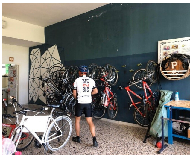
Officina presso il Salento Bike Caffè San Nicola LE