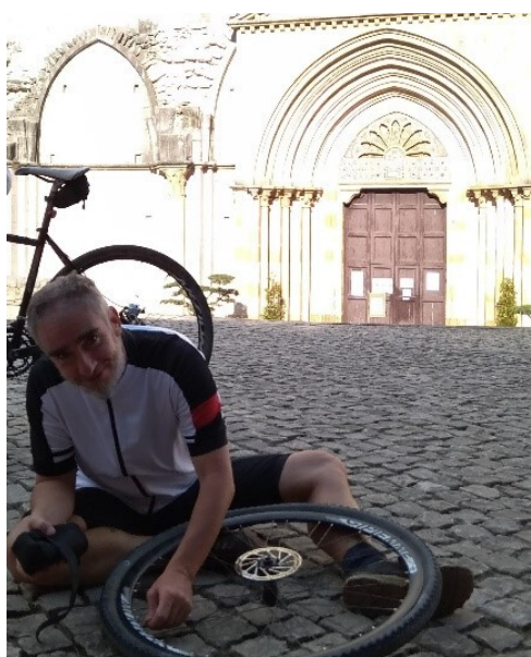
Manutenzione e cultura (Tuscania)

Il ViB è un turista che ha capito che parte fondamentale dell'esperienza turistica è il viaggio in se, è godere del panorama, delle soste, non è solo raggiungere e consumare un punto di interesse turistico. Il ViB è un camminatore in bicicletta, che può quindi percorrere un sentiero ed una via potendo anche fare delle deviazioni e avere minori vincoli. Il ViB è un turista disposto a spendere, specie se straniero, ha la disponibilità di comprare pacchetti viaggio ad un valore giornaliero medio/alto (dati Fiab). Il ViB ha un'attenzione ambientale, è attento agli sprechi e alla gestione ottimale dei rifiuti.