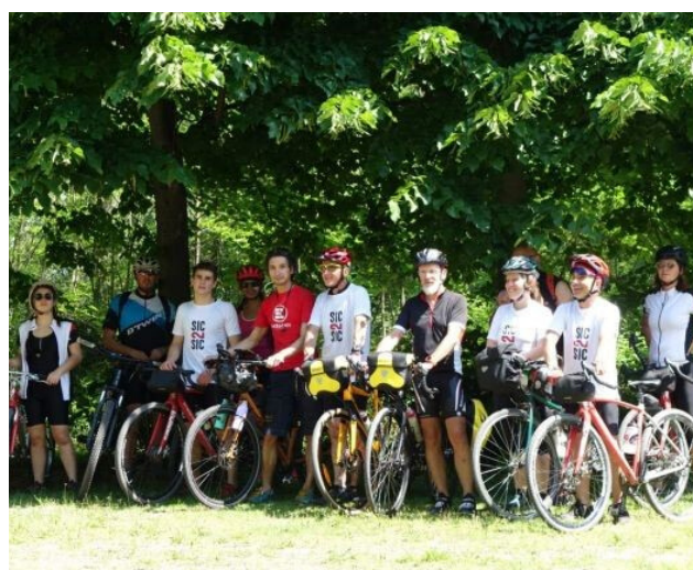
Il gruppo ottimale