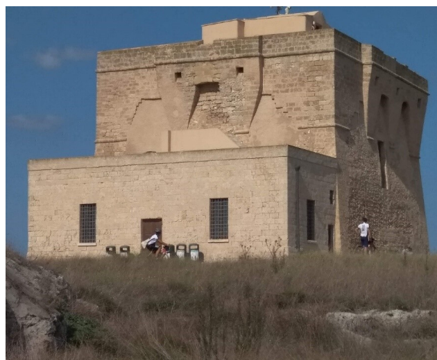
Life Sic2Sic nel Parco Regionale di Torre Guaceto (Carovigno BR)