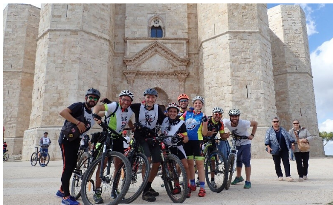
Castel del Monte PUGLIA

Le mete delle tappe dovranno essere distanziate a non oltre 40 km. calcolati sulla strada principale; poiché la percorrenza ciclistica “reale” risulta mediamente 50% maggiore rispetto al percorso individuato su strada principale. Se il percorso è totalmente in piano è possibile prevedere una tappa più lunga, con il rischio però di non trovare strade idonee per la sicurezza dei ciclisti. Le tappe montane, se possibile, devono essere affrontate da monte a valle, prevedendo il trasferimento del gruppo con altri mezzi di trasporto. Un viaggio del genere è programmabile ovunque sul territorio nazionale, tenendo però conto dei limiti delle grandi aree urbane, delle aree interne appenniniche (più impervie e meno strutturate rispetto alla maggioranza delle aree alpine) e delle aree interne delle grandi isole.