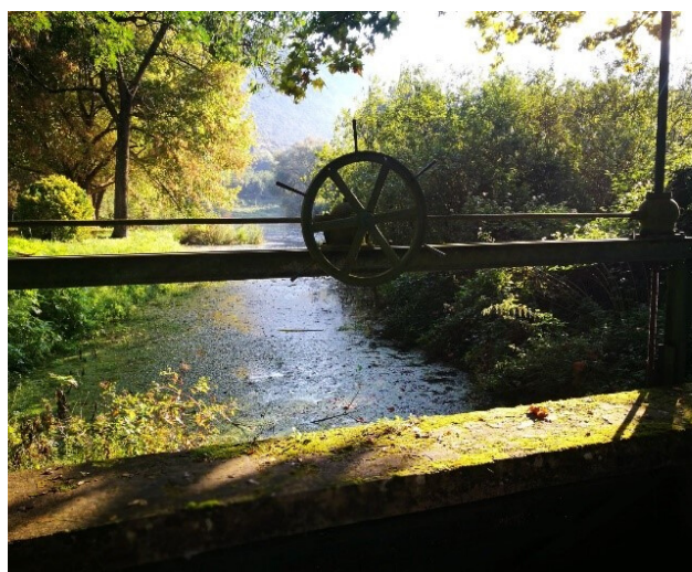
Elementi di paesaggio Lazio 2018