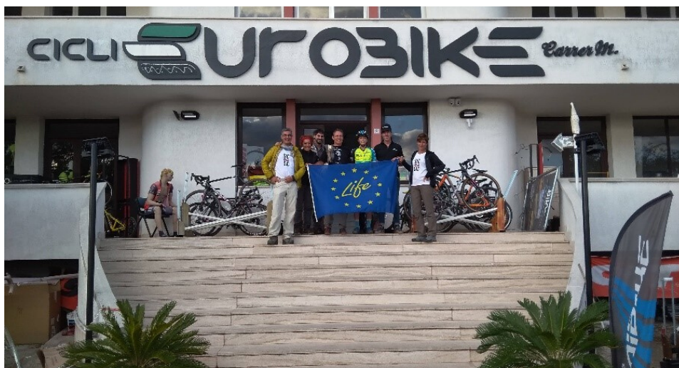
Il Gruppo del ViB presso un ricambista

Il viaggio in bici deve essere ben programmato. Per un pubblico adulto si sconsiglia di viaggiare in maniera estemporanea. Già viaggiare in bicicletta comporta una serie di incognite che possono rallentare il viaggiatore, se in più non sappiamo dove andare o ci perdiamo il viaggio in bici può essere frustrante. Prima di partire, il percorso deve essere tracciato completamente: punti di partenza, strade (con fondo), punto di arrivo e luoghi di interesse attraversati e/o visitati. Devono essere programmati gli orari e deve essere sempre previsto un tempo per gestire gli imprevisti.